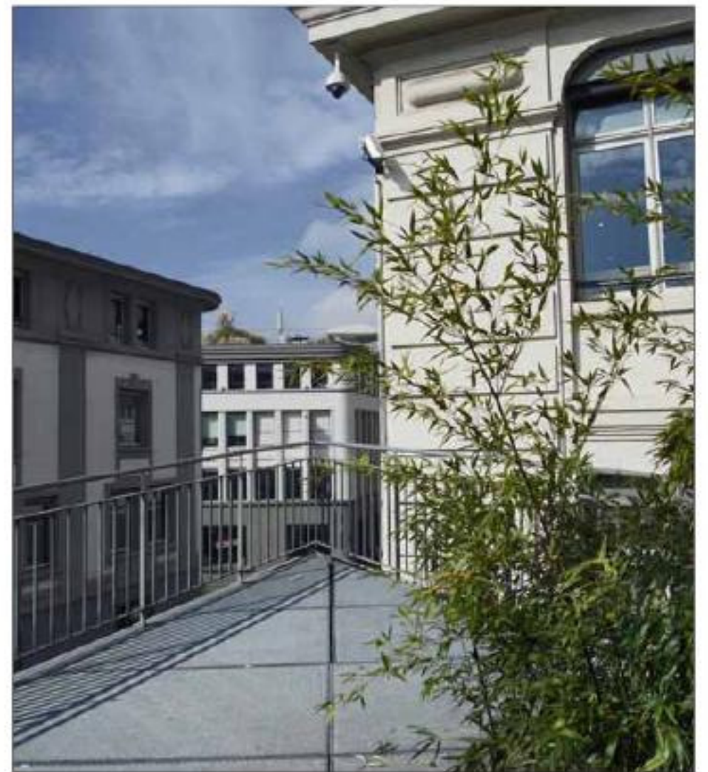
A Lausanne, les caméras de surveillance sont partout, comme ici Place de l'Europe. CHANAR

En ville de Lausanne, on a fait le choix d'une surveillance mesurée: «Il y a surtout des caméras aux abords de certains bâtiments dans le but d'identifier des