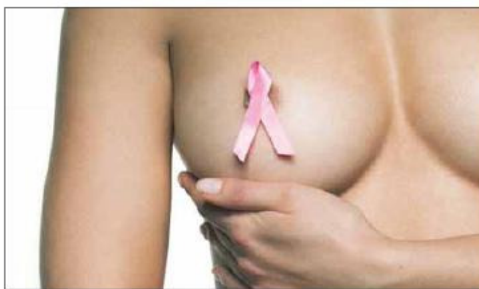
Chaque année en Suisse, plus de 5000 femmes sont touchées par le cancer du sein. av

Pour ce faire, l'Association Beautiful ABC (after breast cancer) fournit, par le biais de son site web et de ses bénévoles, les informations qui visent à faire