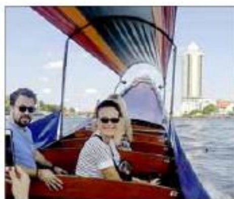
Les meilleurs hôtels plongent sur la rivière Chao Praya.

Une exploration plus attentive vient pourtant nuancer cette vision d'un skyline globalisé. Chinatown, par exemple, fait figure de labyrinthe pittoresque, avec ses cantines à même le trottoir, commerces de bijoux et tissus en tous genres. Dans ce bric-à-