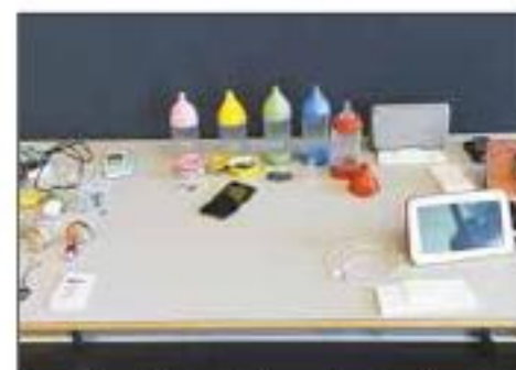
Les trois objets créés par les étudiants lausannois.

lyse de l'eau déguisé en console de jeu. Il a pour but de rendre la science ludique, en encourageant par exemple les enfants à découvrir l'endroit le plus froid d'un ruisseau. Quant à Vesta, ce prototype malin veut reconnecter les seniors à la jeune génération grâce à une tablette simplifiée. Sorte de support pour cartes postales virtuelles, elle peut recevoir en un clic des photos et des messages envoyés via un smartphone. PK