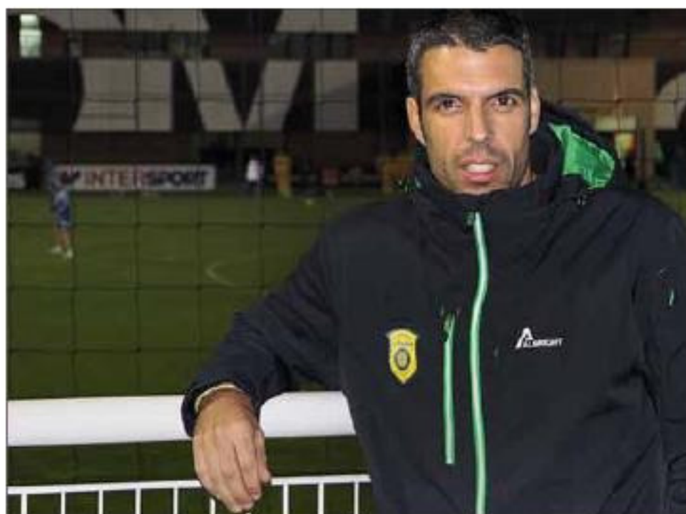
Fabio Celestini, un style qui plaît avec des résultats en bout de course. »

pas par rapport au classement. A l'heure qu'il est, il y a quelques joueurs qui se situent en-dessous de ce que je suis en droit d'attendre d'eux. Désormais ils ont deux mois pour montrer quelque chose de différent, réagir, me convaincre. J'ai besoin d'avoir une équipe homogène, comme j'ai besoin d'aimer les joueurs.