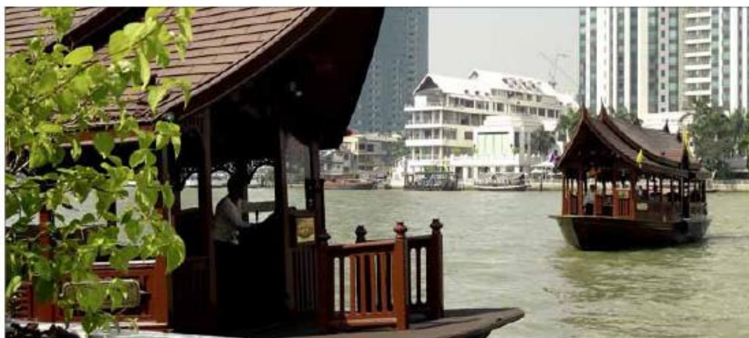
Romantisme des anciennes barques à riz thaïlandaises.

Parcourant cette fascinante Metropolis, on pourrait facilement n'en retenir que la surface : un décor de science-fiction, façon Blade Runner ou Gotham City.