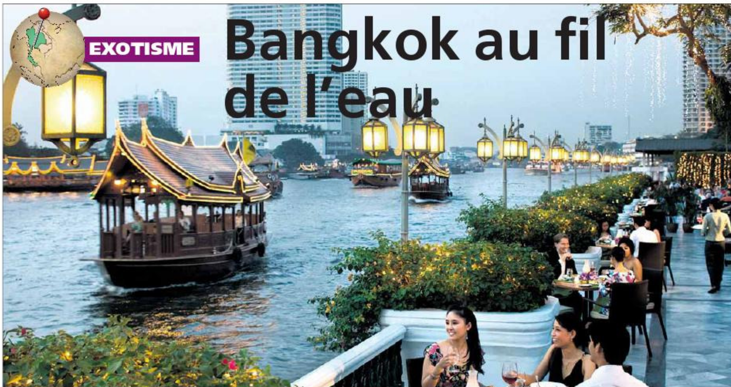
Spectacle permanent le long du klong (canal) Mon. 5x

ORIENT • Celle que l'on a surnommée la Venise du Sud-est asiatique a gardé quelques vestiges de son impressionnant réseau navigable. C'est là qu'il faut chercher les parfums de l'ancien Siam.