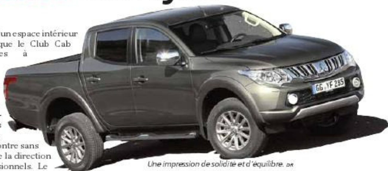
Une impression de solidité et d'équilibre.

En l'allégeant, en le redessinant, Mitsubishi pense pouvoir le vendre à 200'000 exemplaires par année, contre 130'000 pour son prédécesseur. Une ambition légitime fondée sur un bel effort de modernisation. Il se remarque aussi à une connectivité complète. Sur le plan esthétique, le pick-up L200 abandonne les lignes courbes un peu trop audacieuses pour une partie du public. Les concepteurs ont dégagé une impression